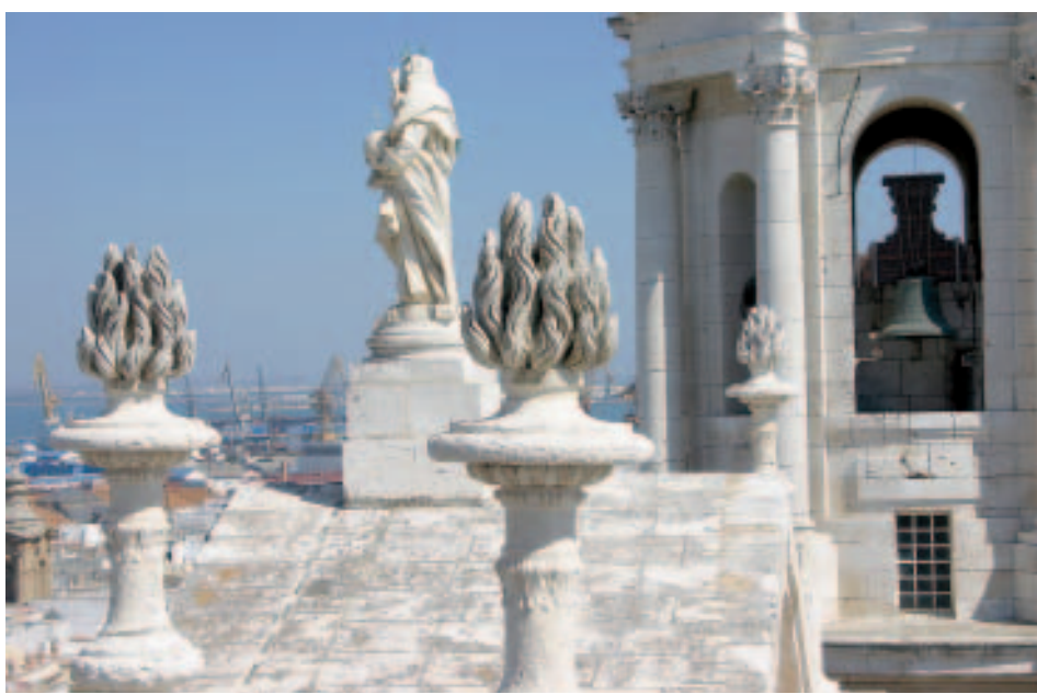
Über den Dächern von Cádiz: Blick vom Westturm der Kathedrale

der seinen besonderen Reiz aus dem unter Naturschutz gestellten Hinterland bezieht. Auf dem Düngürtel wachsen Pinien und phönizischer Wacholder, mit etwas Glück sieht man hier sogar Chamäleons.