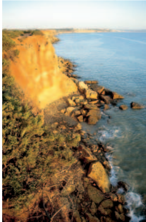
Natur pur: Bucht bei Conil (Provinz Cádiz)