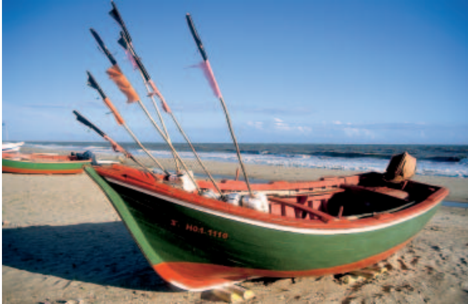
Strahlendes Licht: am Strand von La Antilla (Provinz Huelva)